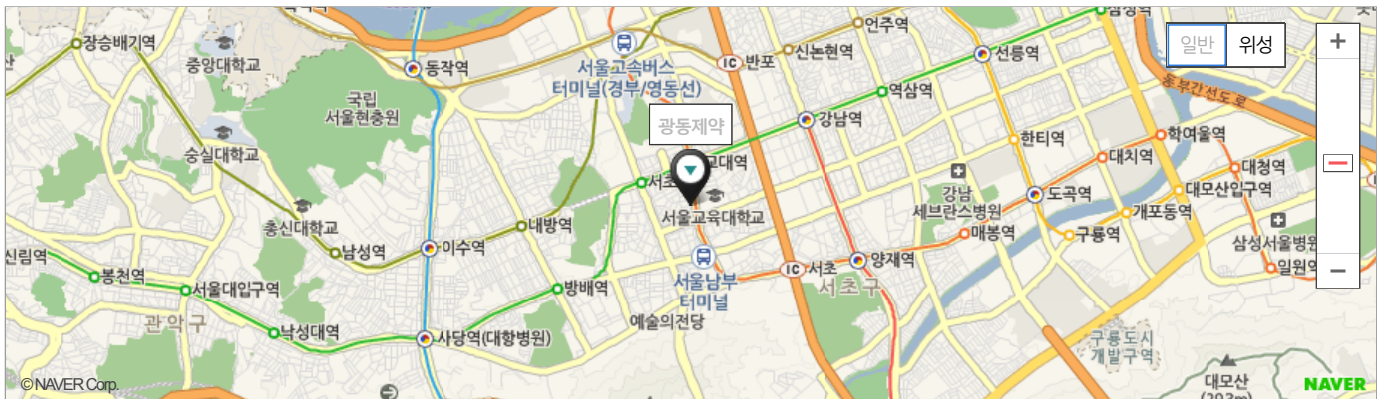
서울 서초구 서초동 1577-4 광동제약 가산빌딩 사옥 (인사팀 7층)

동일 기업이라도 타지역 채용의 경우, 회사 주소와 인근 지하철 정보가 상이할 수 있습니다.