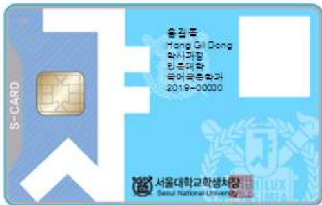
< 앞 면 >